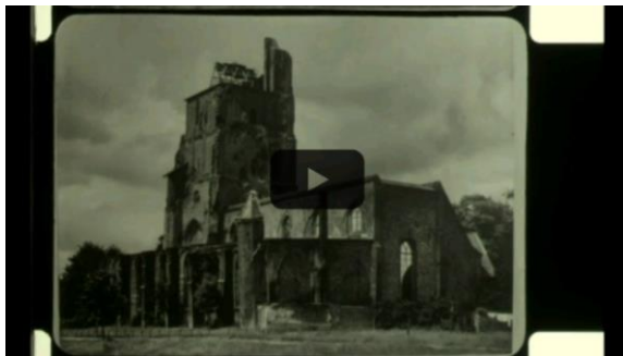
Beelden uit de NTS opnamen

Op de beelden is de verwoesting en het resultaat van het herstel van de St. Maartenskerk goed te zien.